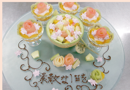
（贅沢なフルーツケーキ）