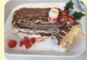
(クリスマスケーキ)