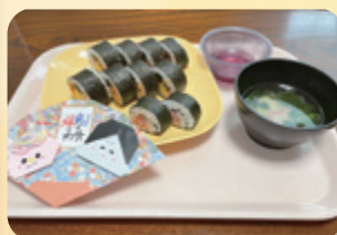
(恵方巻ならぬのり巻き膳)