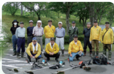
飯館ライオンズクラブの皆さん (早朝から、施設内の草刈りをして頂いています。)