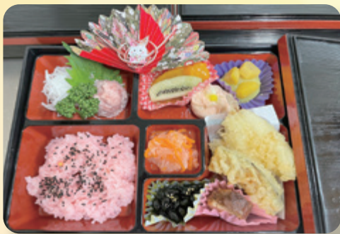
(元旦のおめでとう膳)