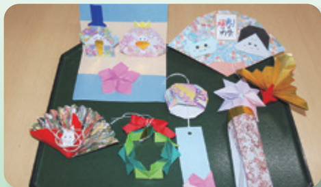
厨房職員の娘さんより、毎月の行事食ごとに、食事を彩るおりがみを頂いています。 「スゴイ！」の一言です。