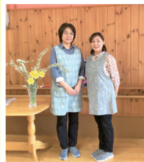
主任介護士・介護支援専門員