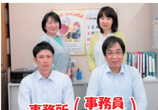
事務所（事務員） 相談員