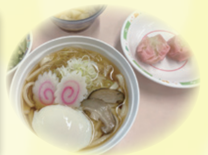
(お月見のうどん定食)