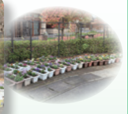
飯館村民生児童委員協議会の皆さん (毎年、苗の準備や花植えをして頂いています。)