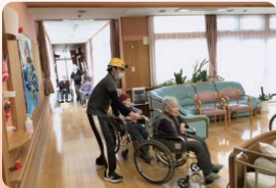
(火災想定避難訓練のもよう)

突然の災害にも備え「毎月1回火災想定避難訓練」「年1回自然災害時の総合訓練」を行っています。