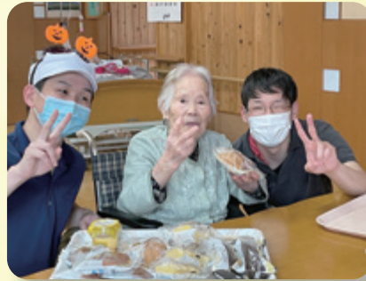
(好きなものを選べるセレクトデザート)