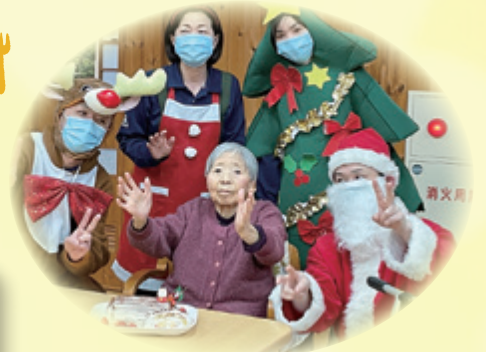
(クリスマスケーキを届けに来ました)