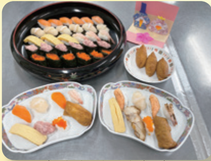
(ひなまつりのお寿司)