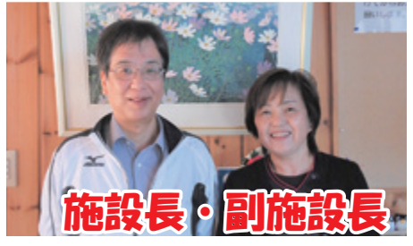
施設長・副施設長