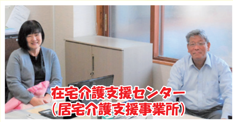
在宅介護支援センター (居宅介護支援事業所)