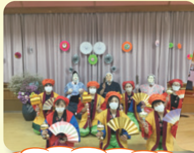
ドヤ顔の面々は全て職員です!