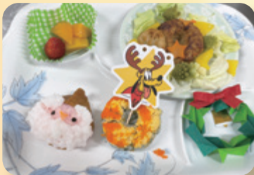
(クリスマスメニュー)